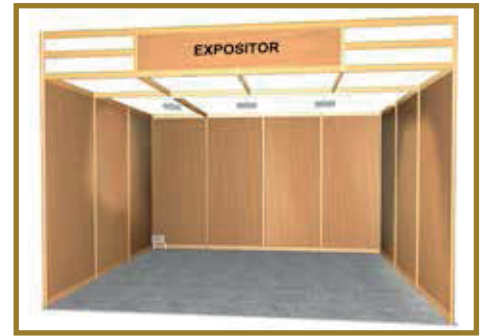
Imagen orientativa. Stand abierto a pasillos. Stand example. Open to aisles.