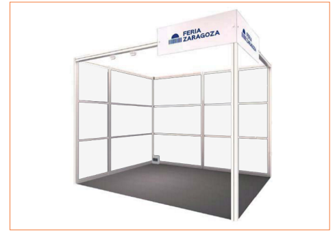
Imagen orientativa. Stand abierto a pasillos. Stand example. Open to aisles.