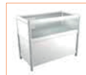
Mostrador vitrina Showcase counter (100 x 50 x 90 cm.) 115,00 €