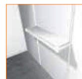
(100 x 25 cm.) 18,00 €