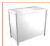
Mostrador Counter (100 x 50 x 90 cm.) 80,00 €