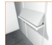
Inclinado/ Bowed (100 x 30 cm.) 27,00 €