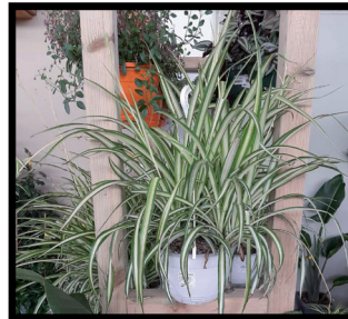
8. Cintas M-15