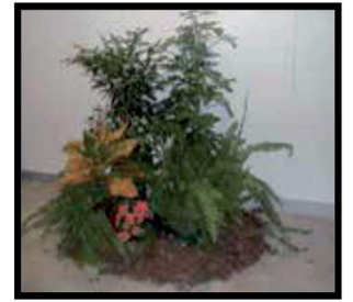
17. Parterre (Min. 1 m. x 0,5 m. x 1 m.)