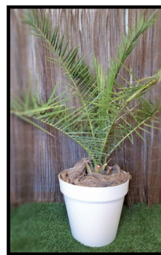
12. Phoenix Canariensis 0,6 / 1 m.