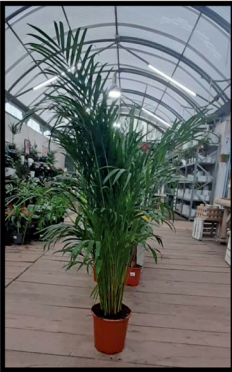
6. Areca 0,8 m.