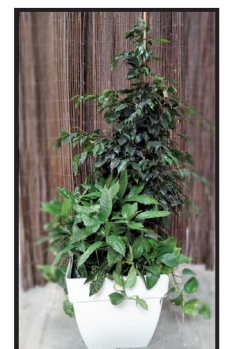
21. Macetero 42 x 42 cm. Ejemplo