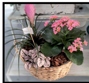
16. Centro de plantas. Ejemplo