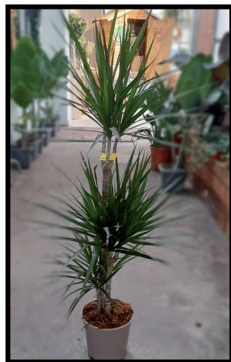
11. Dracaena Marginata 3 TR 1,20 m.