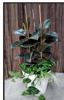
20. Macetero Ø 45 cm. Ejemplo