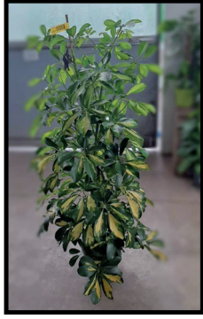
2. Schefflera 1,20 / 1,50 m.