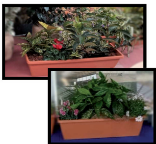
18. Jardinera Mix 80 x 20 cm. Ejemplo