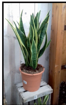
14. Sansevieria 0,5 m.