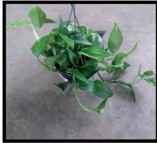
7. Potho M-14