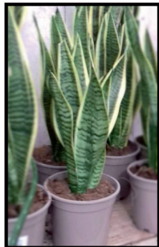
15. Sansevieria 0,3 m.