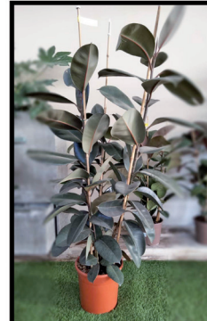
4. Ficus Robusta 0,8 / 1,20 m.