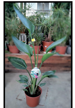
13. Ave del Paraíso sin flor M-22