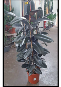
5. Ficus Robusta 1,20 / 1,50 m.