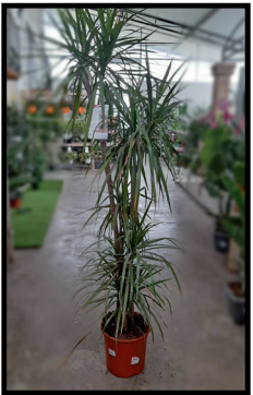
10. Dracaena Marginata 5 TR