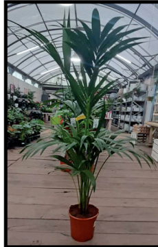
3. Kentia 1 m.