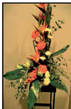
19. Centro floral. Ejemplo